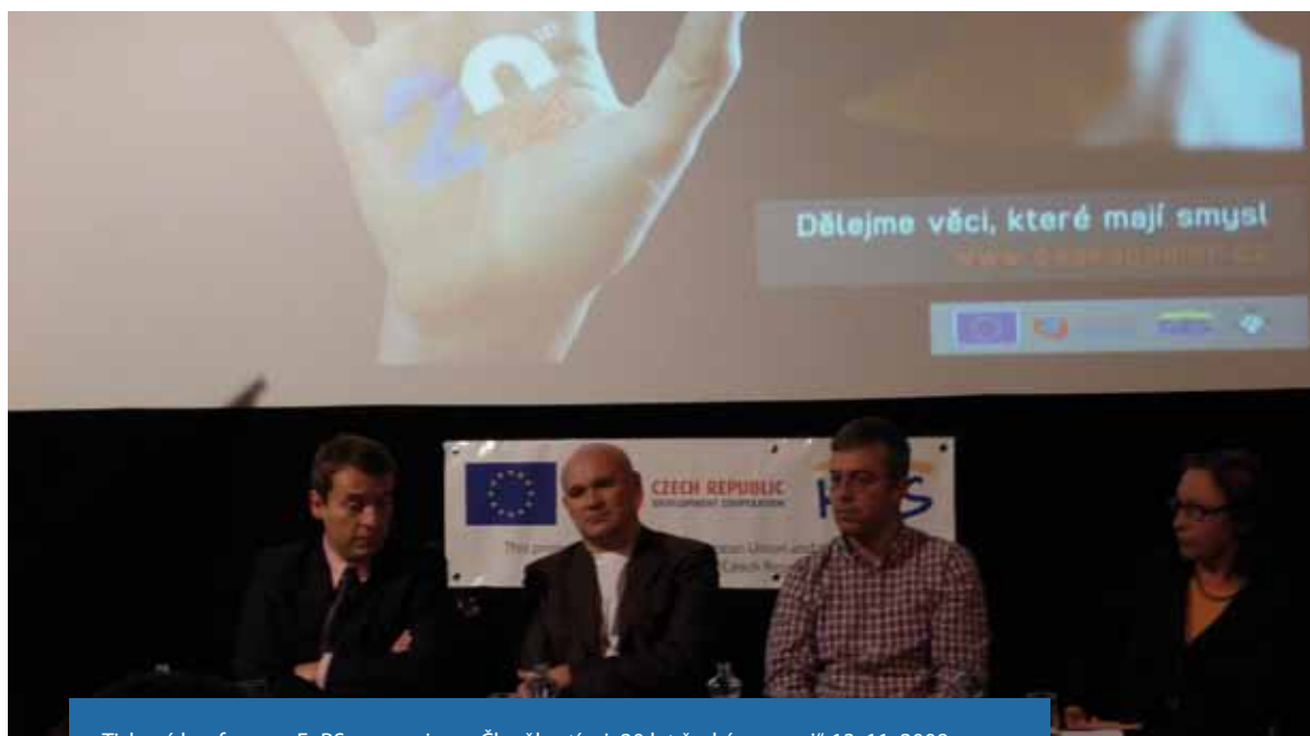
Tisková konference FoRS a organizace Člověk v tísni „20 let české pomoci“, 13. 11. 2009

FoRS společně se svými členy a dalšími partnery vydal 10 tiskových zpráv k vybraným tématům, vystupoval v médiích a publikoval odborné články, rozhovory a příběhy o rozvojových projektech členských a pozorovatelských organizací (viz příloha). FoRS také uspořádal dvě tiskové konference. První z nich s názvem „Rozvojová spolupráce nesmí být v době ekonomické krize odstavena na vedlejší kolej“ se uskutečnila u příležitosti uvedení hodnotící zprávy CONCORD „Lighten the Load“ (ve spolupráci s Informačním centrem OSN v Praze, 14. 5.). Další tisková konference proběhla k uvedení české aidwatch zprávy „Česká pomoc na rozcestí“ a zahájení kampaně 20 let české pomoci (Kino Světozor, 13. 11.). Odezvy v médiích, které přispěly ke zviditelnění ZRS a větší informovanosti veřejnosti, jsou uvedeny v příloze.