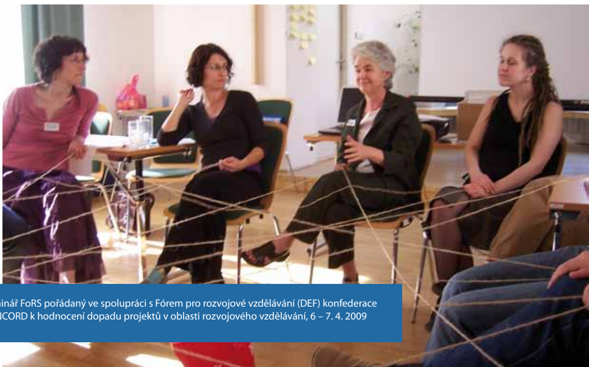
Seminář FoRS pořádaný ve spolupráci s Fórem pro rozvojové vzdělávání (DEF) konfederace CONCORD k hodnocení dopadu projektů v oblasti rozvojového vzdělávání, 6 – 7. 4. 2009

Důležitou oblastí podpory kapacit je poskytování informací o financování rozvojových projektů NNO. FoRS průběžně zprostředkoval kontakty mezi zájemci o podávání evropských projektů a související poradenství. V rámci projektu EuropeAid Helpdesk byl rozvíjen servis členským organizacím k úspěšnému plánování a realizaci projektů. Zájem o evropské projekty se zvýšil a počet proškolených organizací narostl, proto lze očekávat ještě vyšší zapojení do očekávaných nových výběrových řízení v roce 2010.