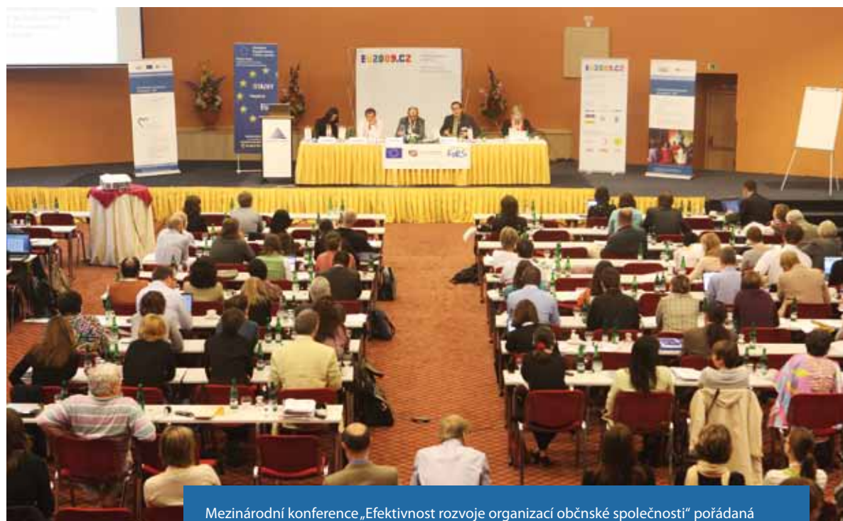
Mezinárodní konference „Efektivnost rozvoje organizací občanské společnosti“ pořádaná FoRS v Praze, 23. -24. 6. 2009

Externí hodnocení předsednického projektu shledalo, že projekt byl velmi relevantní a dobře načasovaný vzhledem k zahajovanému procesu Otevřeného fóra na globální úrovni i probíhající transformaci ZRS na české úrovni. Bylo doporučeno promítnout principy efektivnosti do praxe, zapojit do procesu více NNO a rovněž posílit osvětu u veřejnosti.