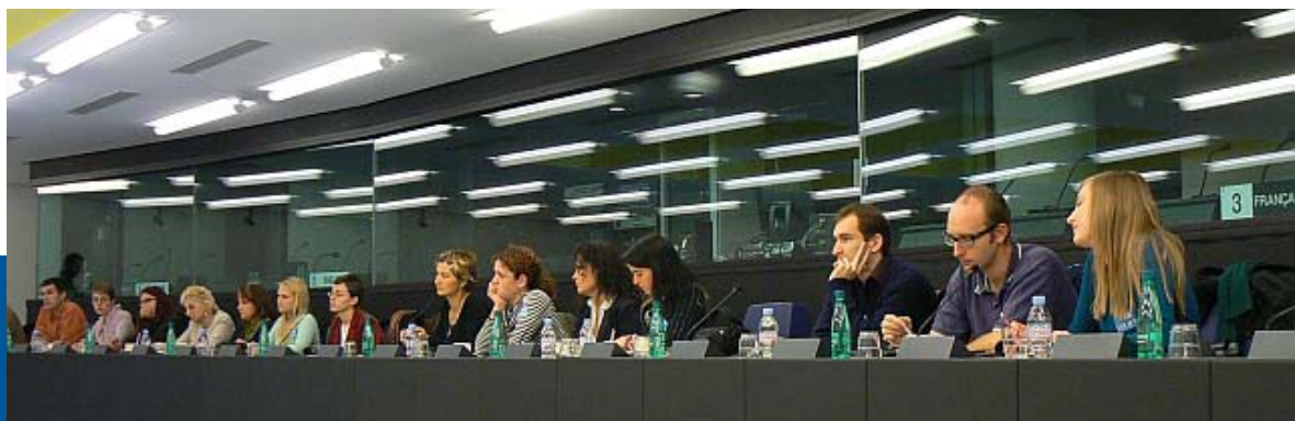
Zástupci členských organizací FoRS na návštěvě v Evropském parlamentu, Štrasburk