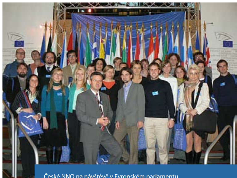
České NNO na návštěvě v Evropském parlamentu

FoRS je jedním ze zakládajících členů organizace CONCORD, Evropské konfederace NNO pro humanitární pomoc a rozvoj (European NGO Confederation for Relief and Development www.concordeurope.org ). CONCORD je zastřešujícím sdružením národních platform a sítí NNO ze zemí EU, jež dohromady zastupují více než 1600 NNO. CONCORD je oficiálním partnerem institucí Evropské unie a jeho prostřednictvím platforma FoRS mj. hájí zájmy NNO z ČR i dalších nových členských zemí EU.