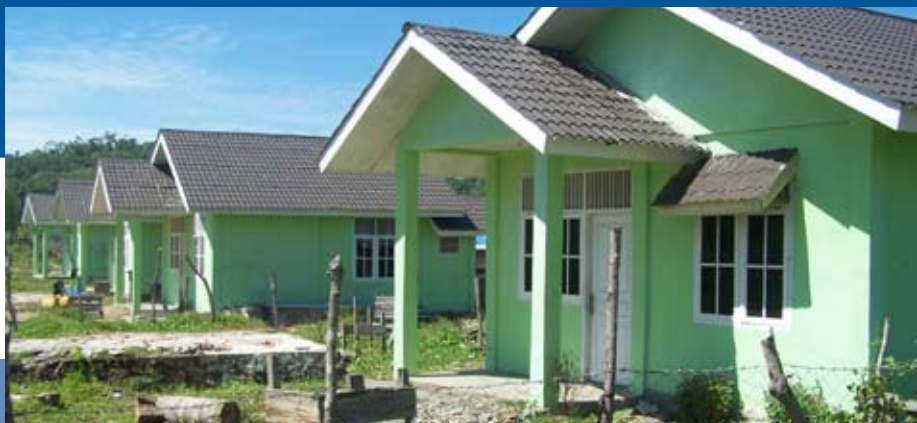
Charita ČR rekonstruuje domy po Tsunami, Indonésie