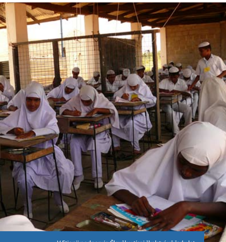
V Etiopii podporuje Člověk v tísni školství už řadu let

Zástupci FoRS a členských organizací se účastnili přes 40 mezinárodních seminářů, konferencí a jednání v zahraničí a 70 dalších v ČR. FoRS dále uspořádalo 33 vlastních akcí a dalších 15 ve spolupráci s dalšími institucemi (zasedání s partnery, pracovní jednání, semináře a školení, diskuse a další).