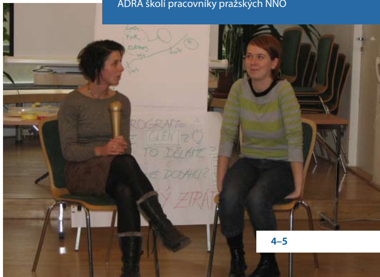
ADRA školí pracovníky pražských NNO