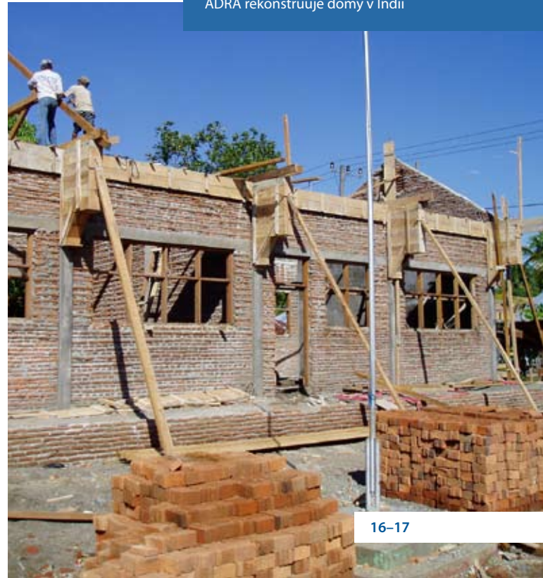
ADRA rekonstruuje domy v Indii

Kampaň se v roce 2007 zaměřila na představení konkrétních možností zapojení do rozvojové spolupráce, které veřejnost má na úrovni jednotlivců, spotřebitelů, dárců, firem apod. K tomu využívala širokou škálu nástrojů: připravila a distribuovala texty, letáky, brožury, samolepky a další informační a propagační materiály; organizovala semináře a besedy; prezentovala rozvojová témata na kulturních, sportovních a dalších akcích jiných organizátorů; pracovala s médii a prostřednictvím médií šířila informace mezi širokou veřejnost. Hlavními akcemi kampaně byly zejména pouliční „Dny proti chudobě“ (ve dnech 14. a 15. září na 30 místech ve 22 městech ČR) a z pozice partnerské organizace „Pochod proti hladu (13. května 2007 v Praze), což je celosvětová akce pro posílení povědomí o problému hladu ve světě a získání finančních prostředků pro Světový potravinový program Organizace spojených národů (World Food Programme, WFP). Dne 15.10. pak proběhla společná Parlamentní debata: „Rozvojové cíle tisíciletí“ – Přispívá Česká republika dostatečně k naplňování Rozvojových cílů tisíciletí a ke zmírnění dopadů klimatických změn?“, které se zúčastnili poslanci Parlamentu ČR, členové Evropského parlamentu, zástupci MZV ČR, Evropské komise a občanské společnosti a další.