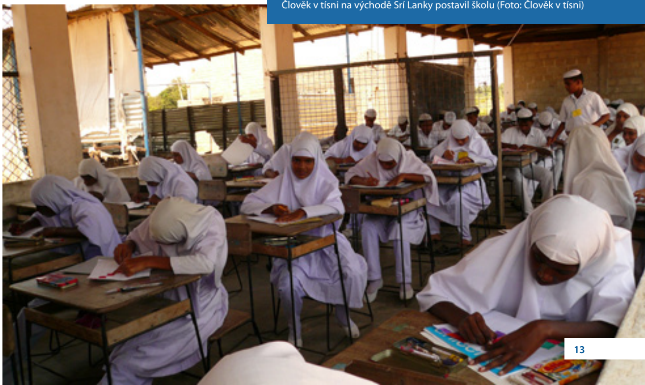
Člověk v tísni na východě Srí Lanky postavil školu